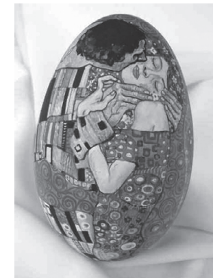
Der Kuss, Red W. Frischeisen