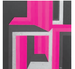
Konkrete Malerei in Acryl von Red W. Frischeisen.