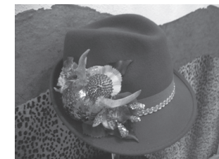
Schwind Achim, originelle Hüte