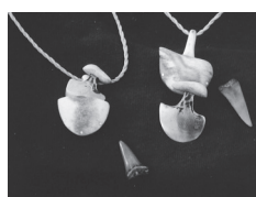
Mohr Renate: Schmuck nach Art der Eskimo