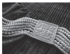
Ihrke Barbara: Kette mit Perlen und Mittelstück in Silber